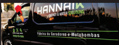
TECHNICAL ASSISTANCE ASSISTANCE TECHNIQUE