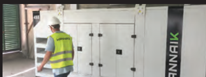
INSTALLATION AND ASSEMBLY INSTALLATION ET MONTAGE