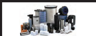
PARTS AND COMPONENTS PIÈCES ET COMPOSANTS

CUSTOMER SERVICE 24/7 / SERVICE CLIENTÈLE 24/7 » (+351) 913 585 000