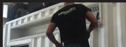
MAINTENANCE CONTRACTS CONTRATS D'ENTRETIEN