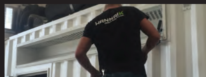
CONTRATOS DE MANUTENÇÃO CONTRATOS DE MANTENIMIENTO