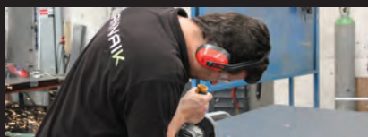
SOLUÇÕES À MEDIDA SOLUCIONES PERSONALIZADAS

HANNAIK proporciona un servicio de atención al cliente 24/7, apoyado por un equipo de ingenieros y técnicos de fábrica, así como, por una red mundial de distribuidores, socios y proveedores de servicios en todo el mundo.